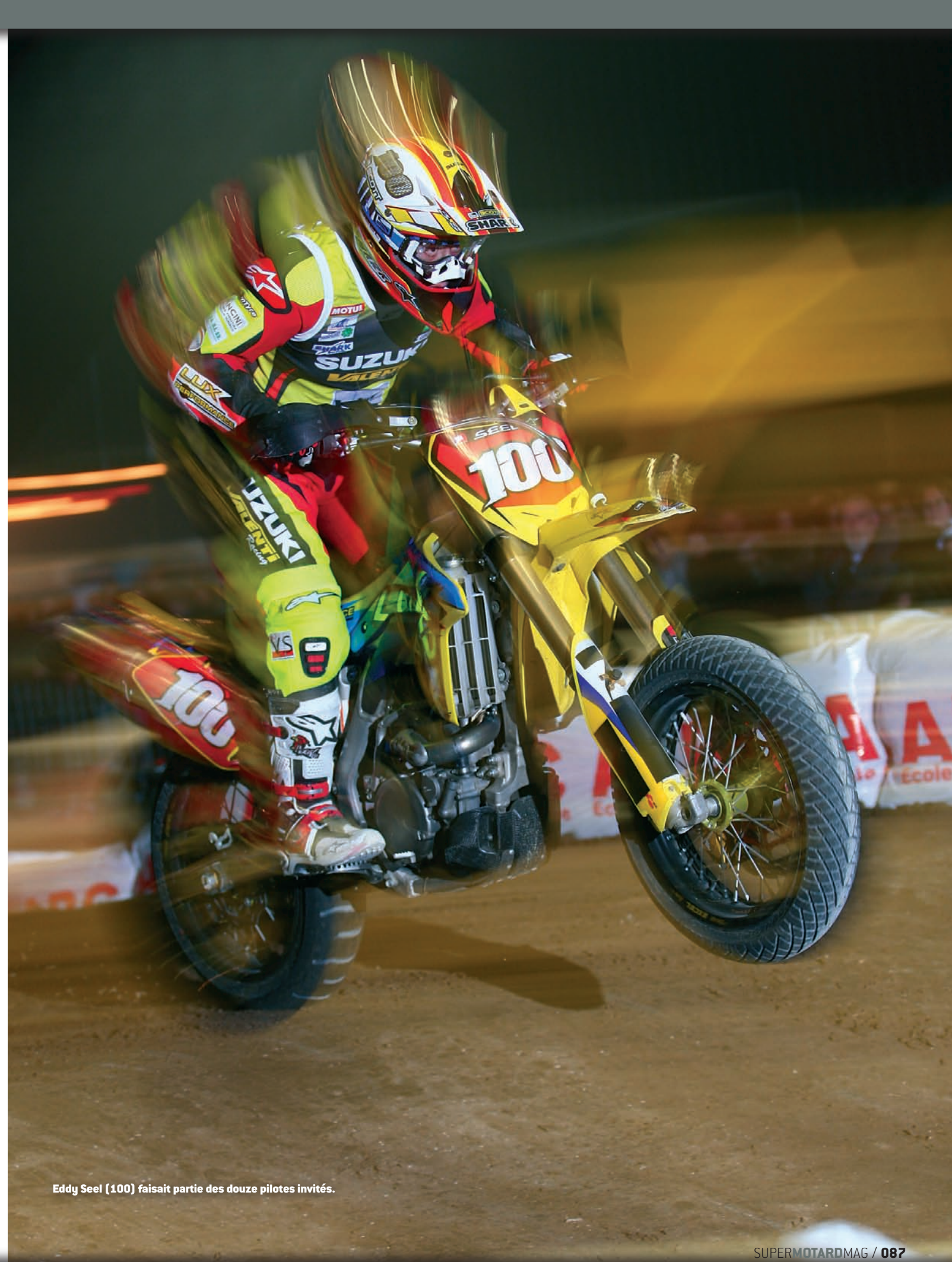
Eddy Seel (100) faisait partie des douze pilotes invités.

La deuxième finale ressemble étrangement à la première, à quelques places près. Devant, c'est toujours le même scénario, avec un Aurélien Grelier survolté qui prend à nouveau un très